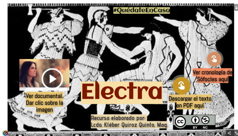
Figura 1: Electra: el mito y la tragedia

didácticos, como se puede observar en la siguiente imagen a ser utilizada para el estudio de la tragedia Electra: