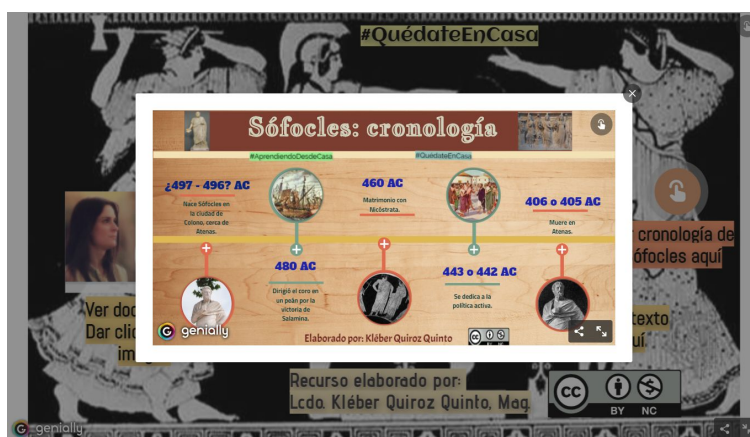
Figura 2: Sófocles. Cronología