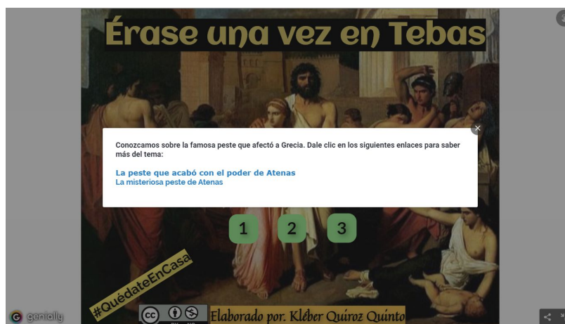
Figura 5: Érase una vez en Tebas. Actividad 2

reacción crítica ante un pasaje de una obra que ellos leyeron el periodo lectivo anterior: Edipo Rey de Sófocles. El segmento elegido procura establecer un paralelismo entre la ficción literaria y la terrible situación generada por la pandemia actual. Son preguntas que exigen establecer una relación entre los contextos interno y externo de la obra. Luego, en la segunda actividad: