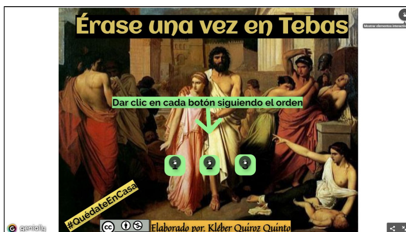
Figura 3: Érase una vez en Tebas